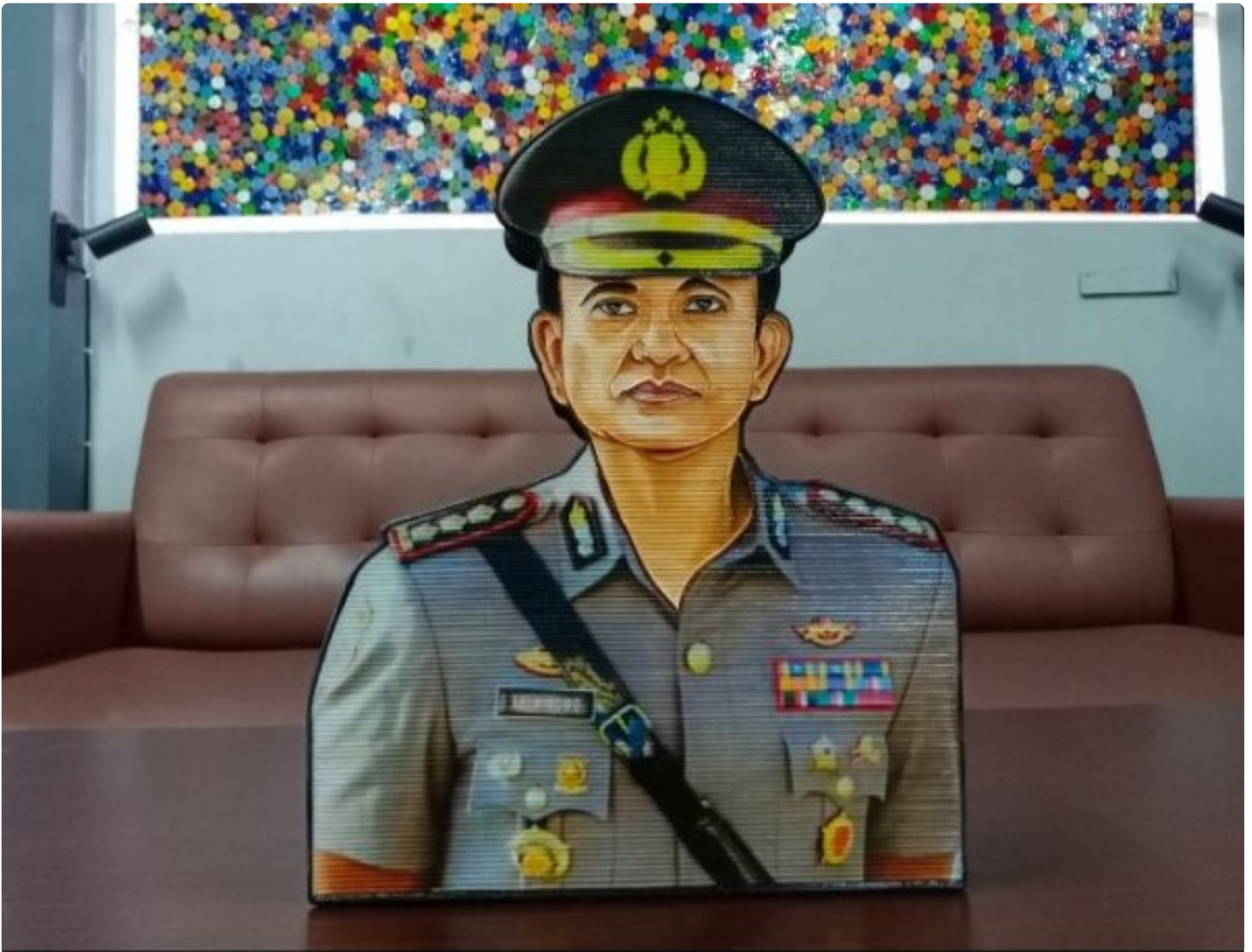
WBP Lapas Purwokerto Manfaatkan Kertas Bekas untuk membuat Celengan Karakter

PURWOKERTO - Warga Binaan Pemasyarakatan (WBP) Lapas Kelas IIA Purwokerto memanfaatkan kertas bekas untuk membuat kerajinan berupa celengan karakter, pada Rabu (23/10/2024).