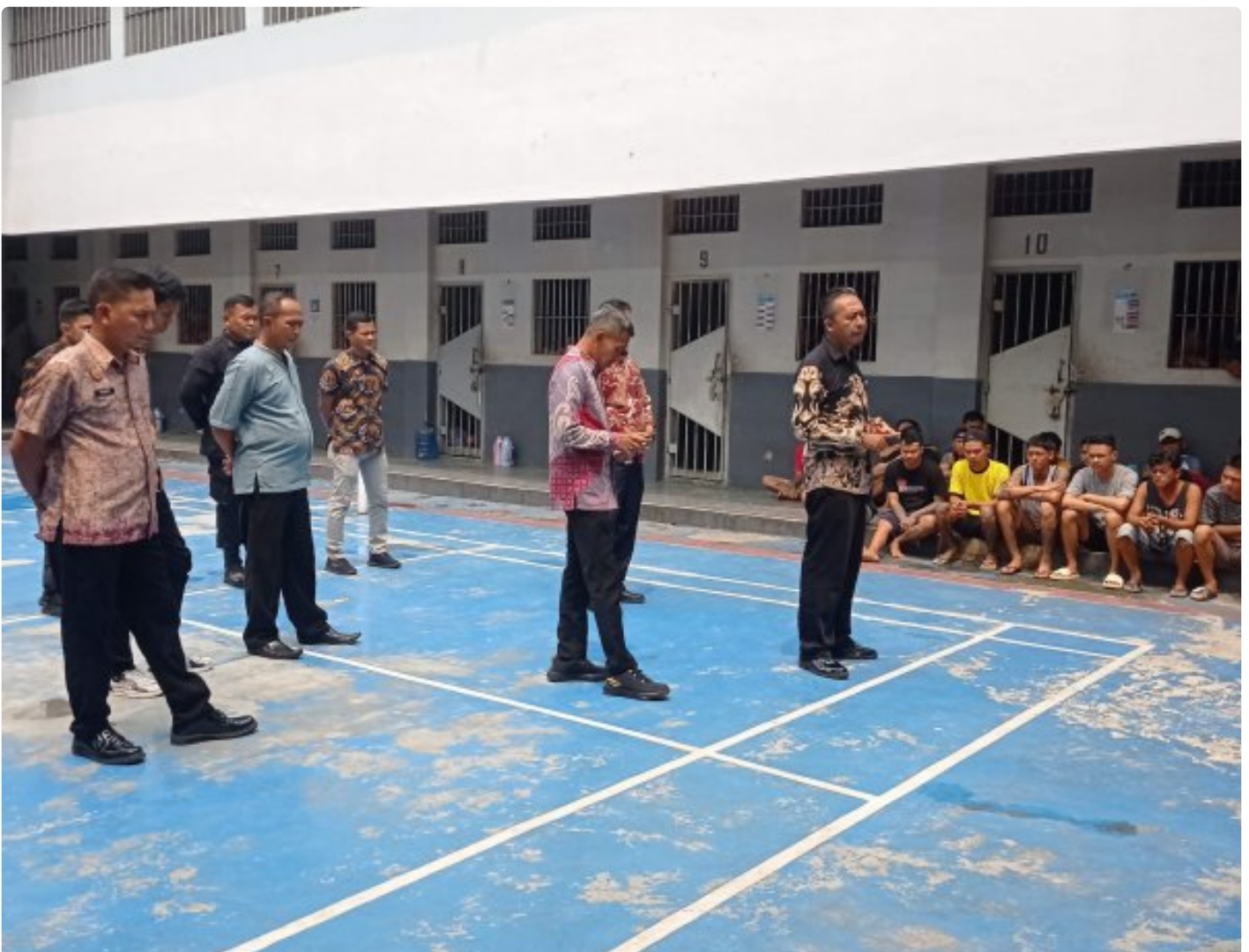
Lapas Purwokerto Tindaklanjuti Arahan Menimipas dan Kadivpas Kemenkumham Jateng

PURWOKERTO - Menindaklanjuti arahan Menteri Imigrasi dan Pemasarakan serta arahan dari Kepala Divisi Pemasarakan Kanwil Jateng Lapas Kelas IIA Purwokerto Menggelar Pengarahan kepada WBP terkait tata tertib, larangan dan